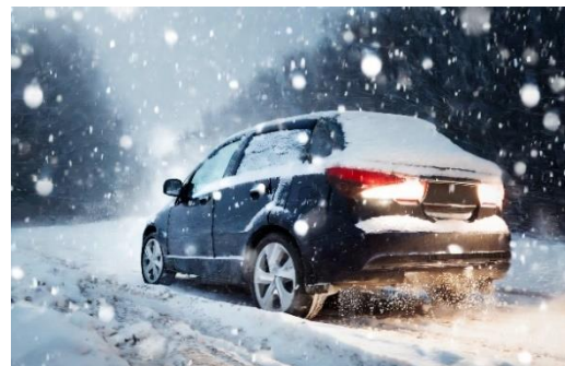
図1 立ち往生車両の冬タイヤ・チェーン装着状況

スリップ事故が多いのは交差点ですが、橋の上、トンネルの出入口付近、日陰で乾きにくい場所などは路面凍結に気が付かないことがあるので注意が必要です。